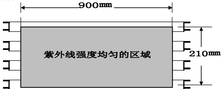
图 2 试验箱均匀辐照区域的范围

3.1.2 荧光紫外灯应快速启动，灯管功率为 40W，灯管长度为 1220 mm，试验箱均匀工作区域的范围为 900 \times 210 mm（见图 2）。